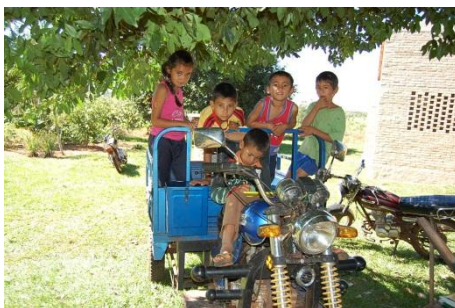
Niños y niñas en la comunidad en la moto-carro que los traslada a la escuela