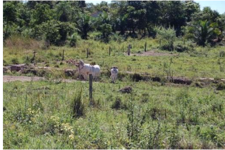
Algunas familias cuentan con ganado vacuno