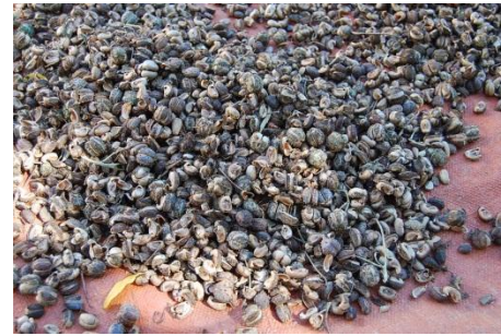
Secado de tártago, destinado a la venta