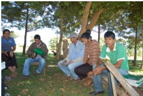
Integrantes de la Comisión Directiva de APAR