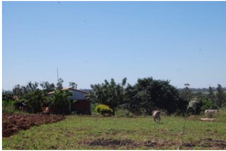
Vista de la comunidad