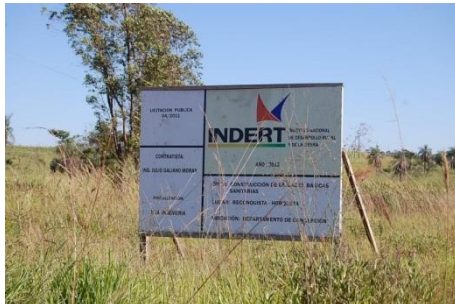
Cartel ubicado a la entrada de la comunidad