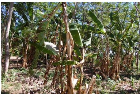
Cultivo de banana