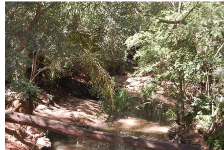
Arroyo que cruza la comunidad, cuya nacimiento se encuentra en medio del sojal