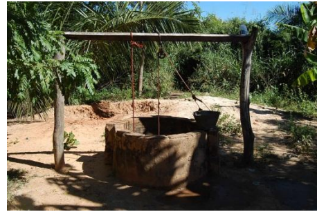
Pozo de agua