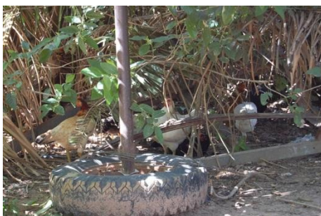
Gallinero tipo de la comunidad