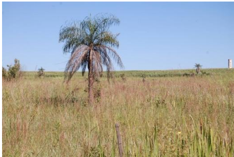
Límite de la comunidad con estancia vecina que se dedica al cultivo de soja