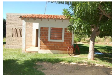
Vivienda de la comunidad, apoyada para el mejoramiento por Programa de SENAVIDAT