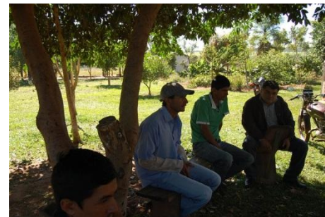
Integrantes de la Comisión Directiva de APAR