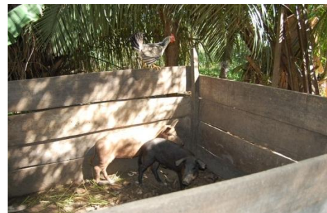
Cría de cerdos