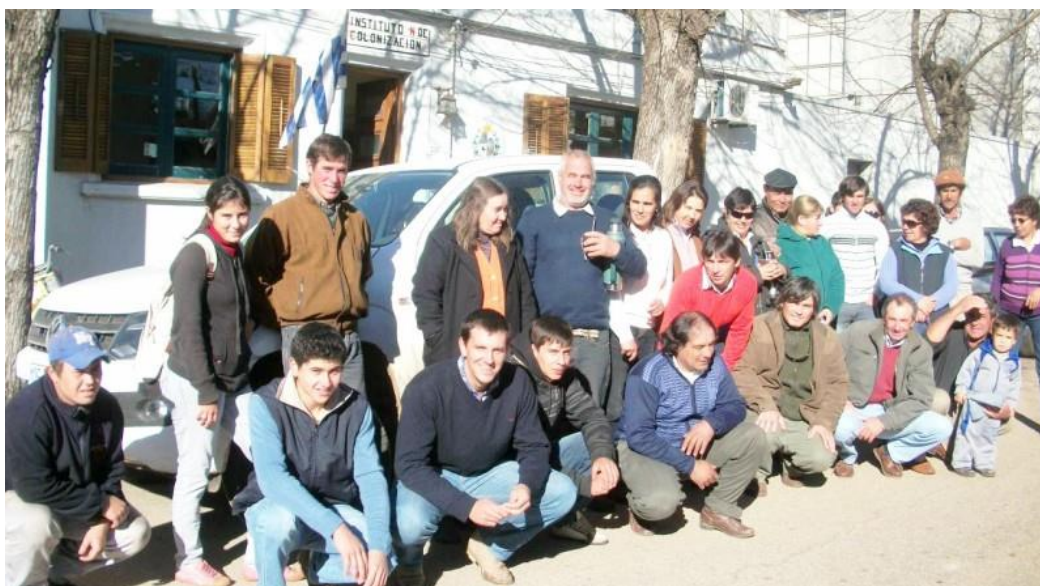
Inscripción del Colectivo Tierra pa' Todos frente a la oficina de la Regional Guichón del INC, año 2012.