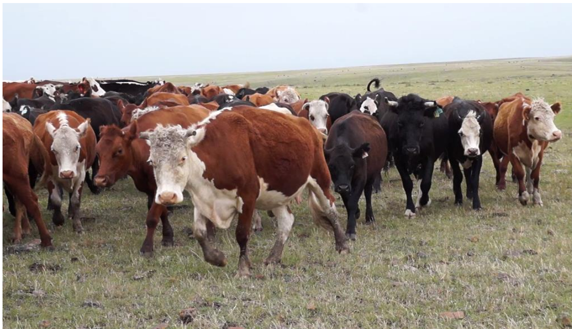
Rodeos individuales y colectivos de la Cooperativa Agraria Tierra pa'Todos. Diciembre de 2016.