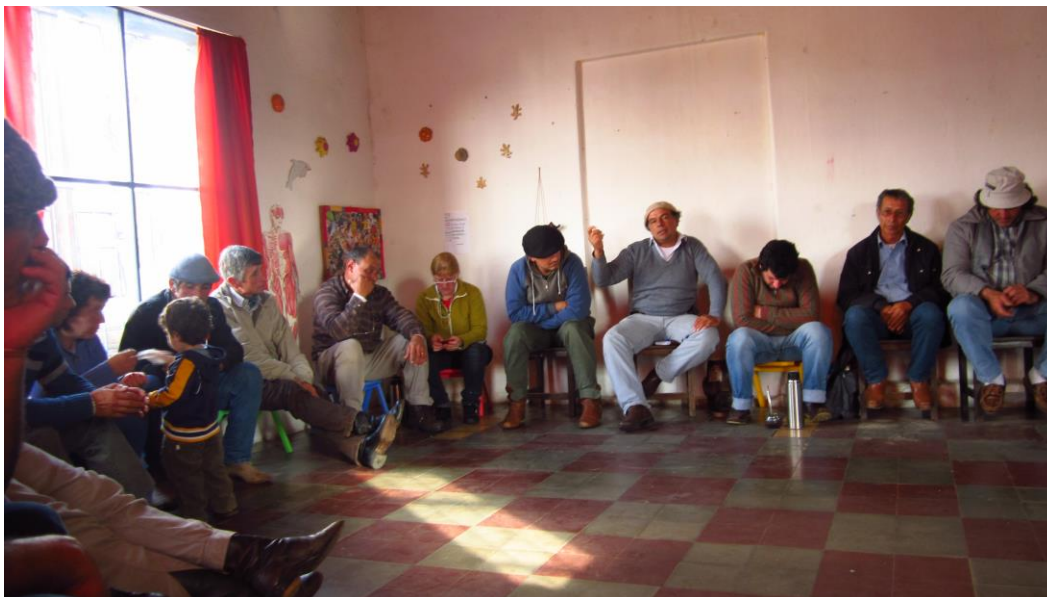
Reunión del Colectivo