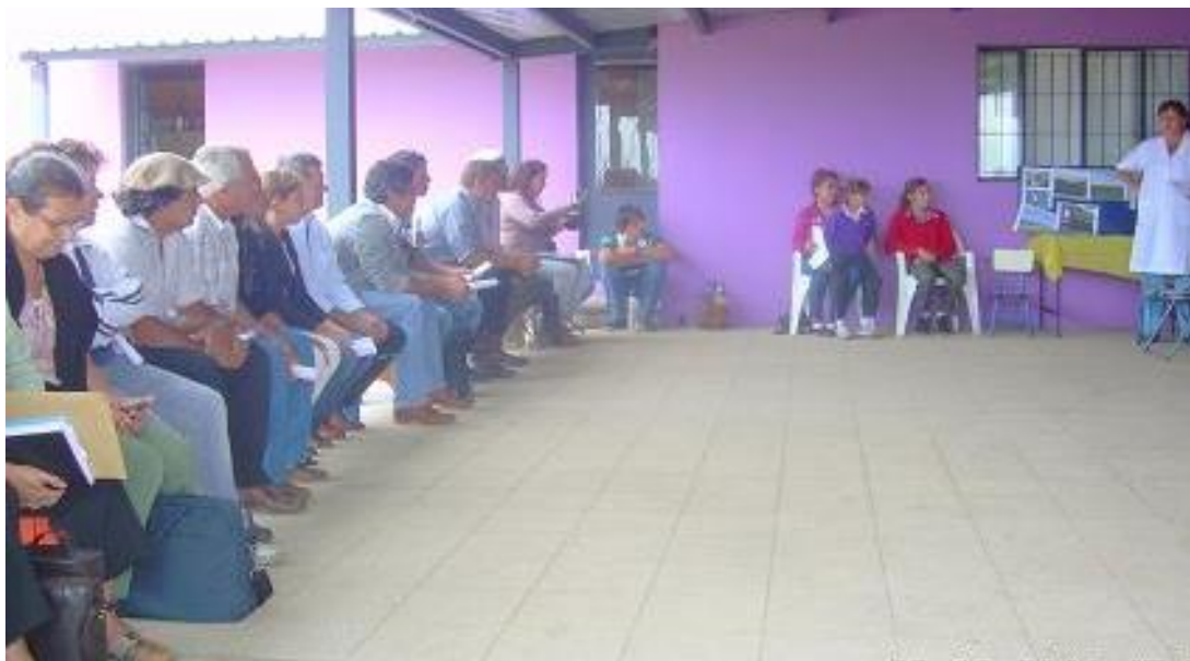
Reuniones del Colectivo en el Centro Infantil Crecer, Ciudad de Guichón, año 2012.