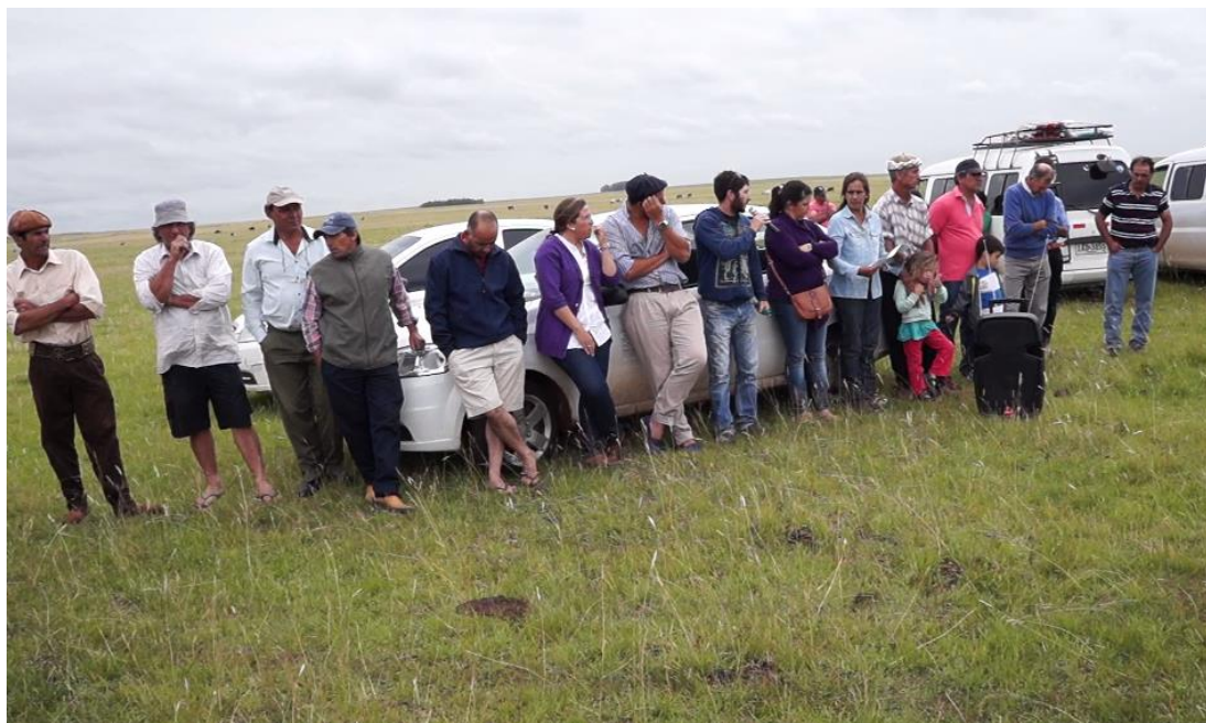
Integrantes actuales de la Cooperativa Agraria Tierra pa' Todos y el Grupo Nuevo Amanecer, durante la Mesa de Desarrollo Rural de Paysandú. Diciembre de 2016.