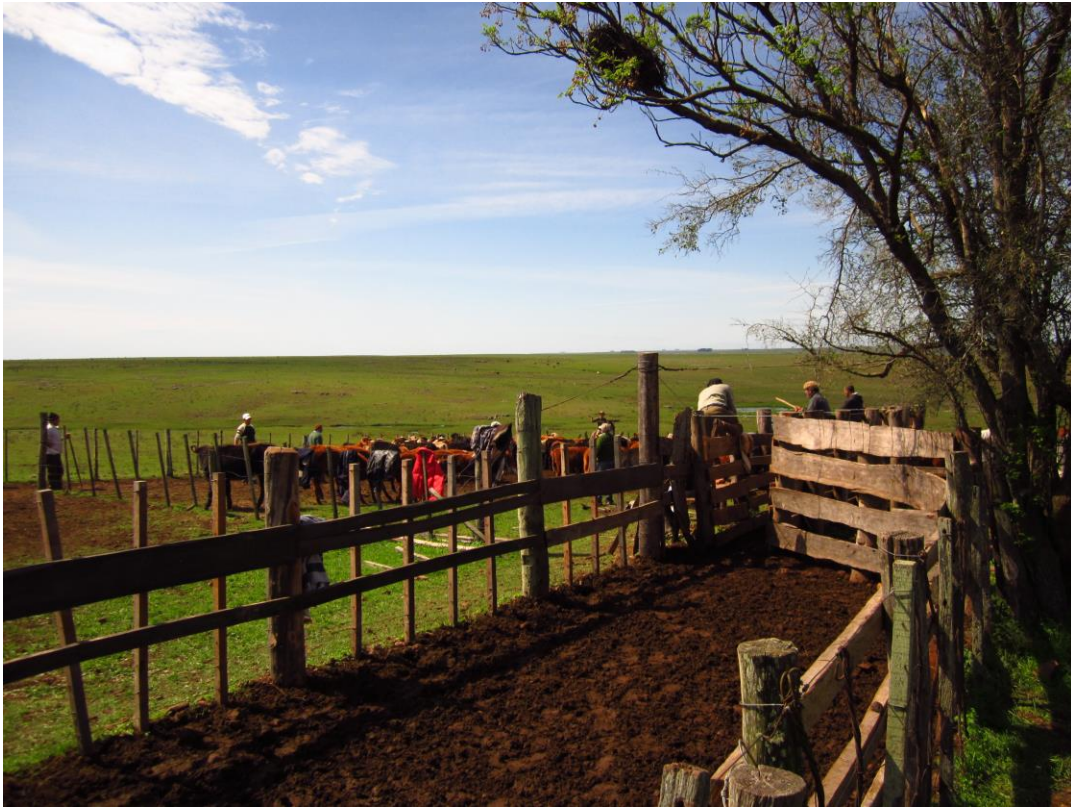
Jornadas de trabajo