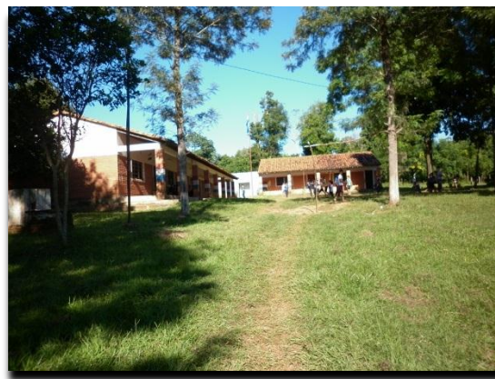
Instalaciones dentro de la escuela

El asentamiento cuenta con una escuela en nivel primario hasta el 9º grado. En total asisten 120 niños. Actualmente se encuentra en gestión ante el Ministerio de Educación y Cultura MEC la posibilidad de incorporar el nivel secundario 1º hasta el 3er. curso. Por su parte, los jóvenes que culminan el 9º grado deben trasladarse a centros educativos de otras comunidades. Respecto a la formación superior, los pobladores ven como