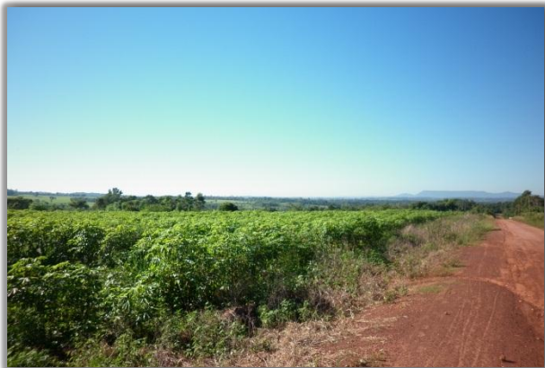
Cultivo de mandioca

Para la producción se utiliza aproximadamente 160 hectáreas. Las prácticas agrícolas realizadas para mejoramiento de suelo son: rotación de cultivos, cultivo de abonos verdes, parcela en descanso, asociación de cultivos, la no quema de restos vegetales, áreas de reserva forestales.