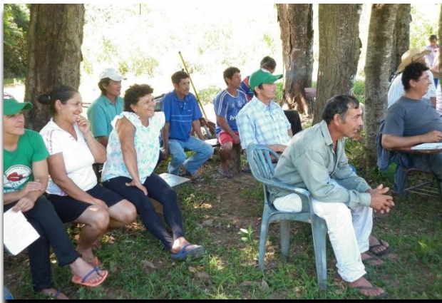
Durante las reuniones de la Comisión Vecinal

La Comisión Vecinal se reunía todos los domingos por la mañana. Para organizar sus acciones, pasando por muchas persecuciones. Al principio de la lucha participaron 250 personas, pero luego se redujeron a 52 personas debido a que no aguantaron, por carecer de credibilidad o por la falta de sacrificio en las tareas de la lucha. También eran tildados de “satánicos” porque se reunían en la comunidad a la misma hora de la misa y la mayoría asistía a la reunión de la Comisión Vecinal, y muy pocos a la misa. Otros pobladores no involucrados decían que se querían apropiarse de lo ajeno. Sin embargo, esto no debilitó a la