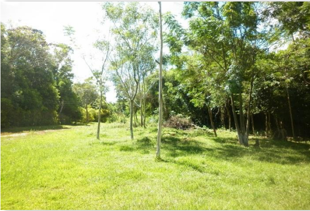
Área forestal dentro del asentamiento

Este esquema de distribución no sigue el esquema tradicional, propuesto por el INDERT, que realiza la parcelación en forma cuadriculada, quedando las casas familiares muy lejanas entre sí, rompiendo el esquema social de la comunidad. Este modelo propuesto por el INDERT está siendo cuestionado, por lo que se están realizando modificaciones, con nuevos asentamientos donde las casas están más cercanas entre sí, y las parcelas agrícolas más lejanas.