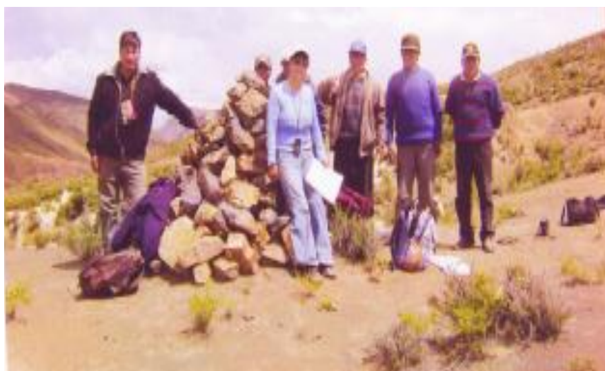
Territorio ancestral: Recorrido de los mojones Yura- Porco (Polígono 2- TCOs) - Jatun Ayllu Yura