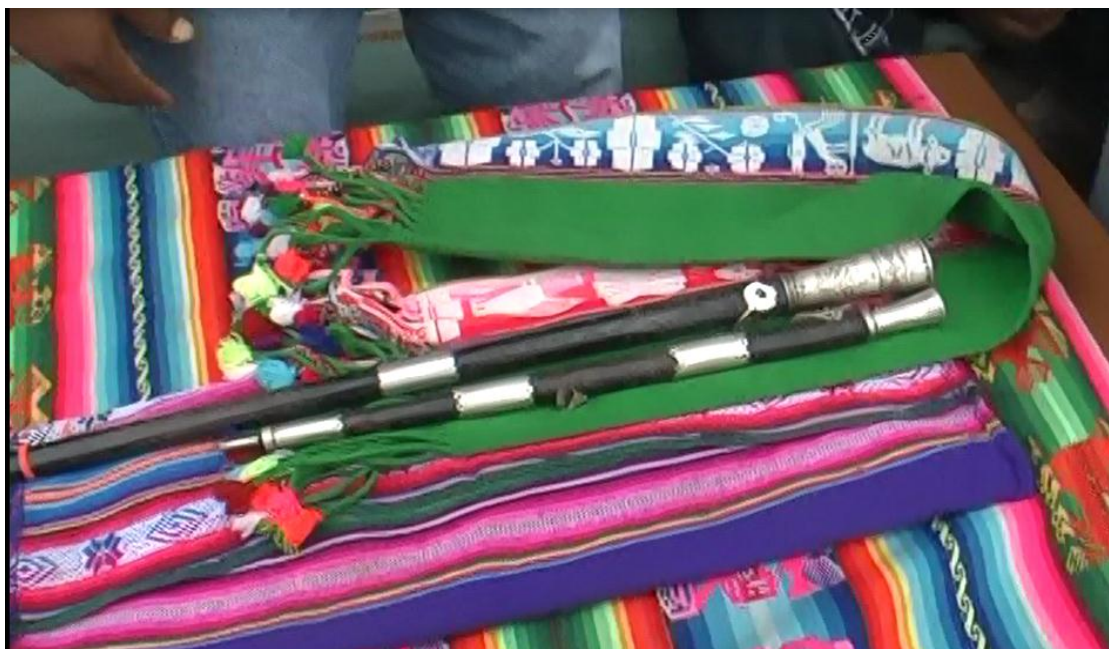
Símbolo Milenario de Pueblos Indígenas Originarios - Bastón de Mando de Autoridad Originaria Kuraca – Jatun Ayllu Yura