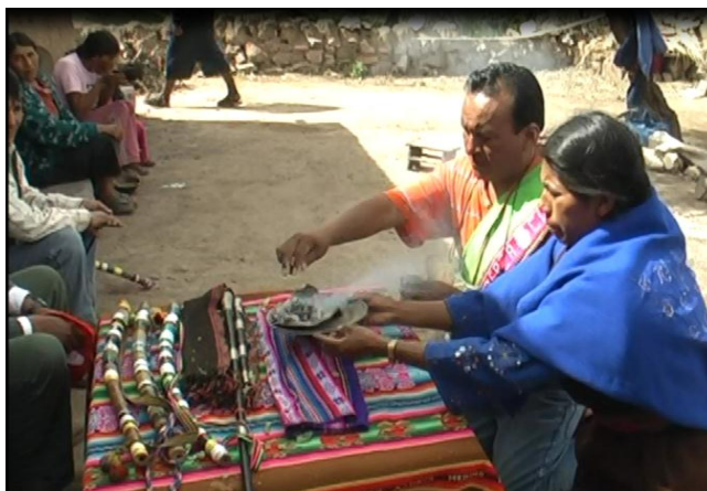
Acto ritual: Kuraca de Ayllu Qullana y su mama thalla (agradecimiento a madre tierra o al territorio)