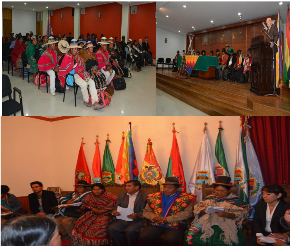
Cabildo de Justicia: Autoridades originarias de Justicia de las naciones y Tribunal Supremo de Justicia Ordinaria y Tribunal Agroambiental