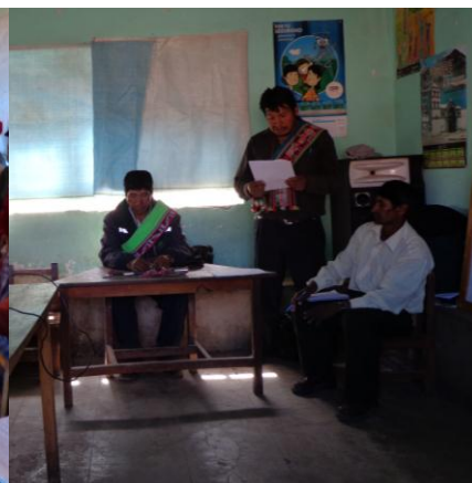
Consejo: Cosejo de autoridades originarias de Jatun Ayllu Yura (Qullana, Wisijsa, Chicuchi y Curca)- Actual Kuraca y exkura