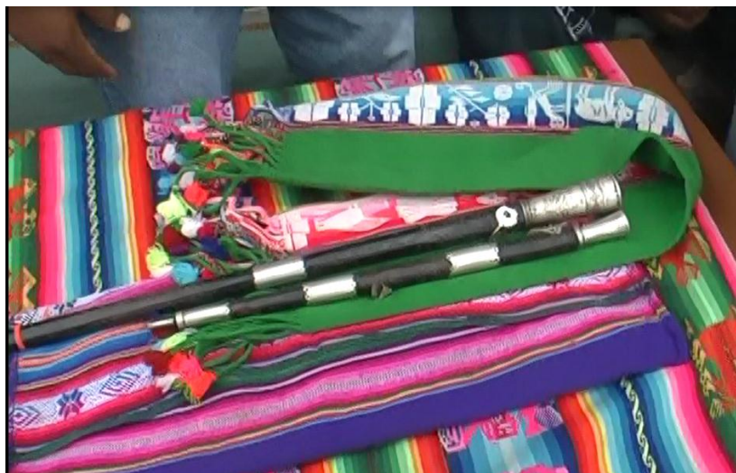
Las autoridades mayores Kuracas llevan bastón de mando o wara que es un símbolo vivo de la cultura milenaria