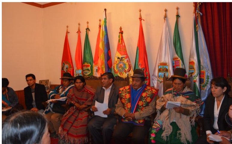
Autoridad de justicia indígena originaria de naciones y autoridades de tribunal agroambiental – 2014