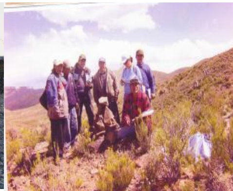
Territorio: Autoridades Originarias de jatun ayllu Yura- Lideres recorriendo los mojones de Ayllu Wisijsa – Jatun Ayllu yura