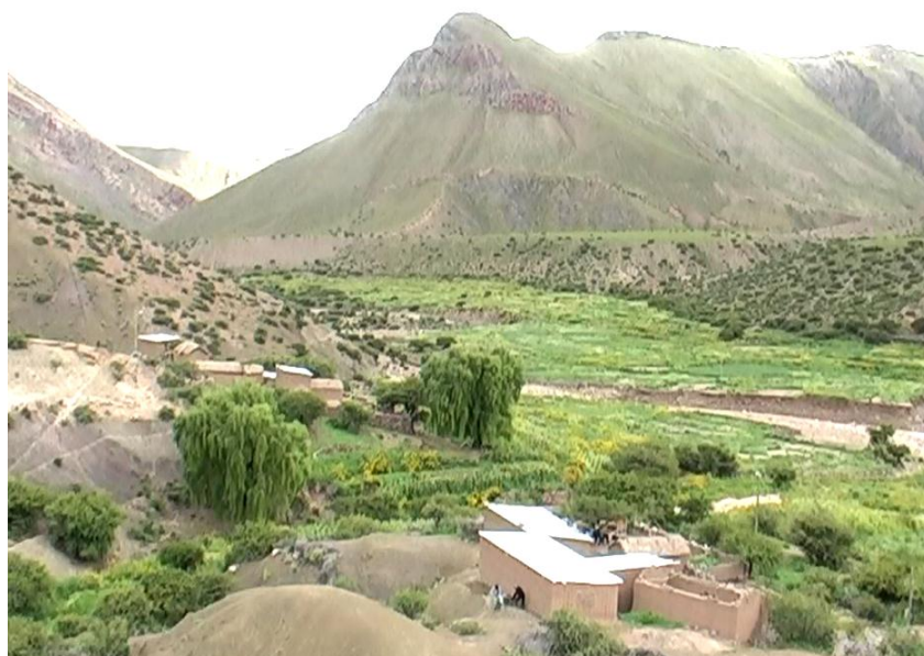
Territorio: Ayllu Qullana- jatun Ayllu Yura-TCOs