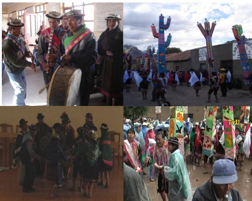
Carnaval: Encuentro de los cuatro ayllus (Qullana, Wisjsa, Checuchi y Curca)