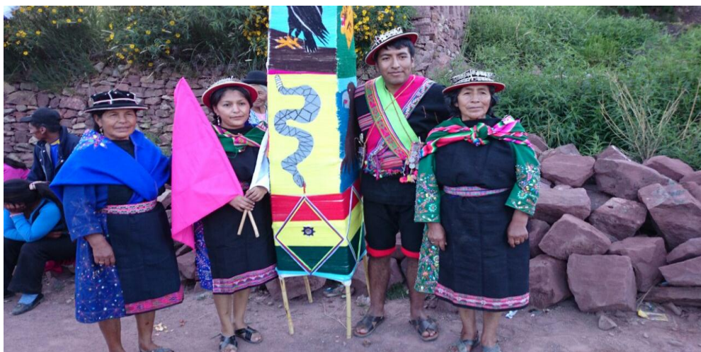
Cultura Yureña: Los Jovenes Valoran la Cultura Ancestral y Exautoridad Kuraca – Jatun Ayllu Yura