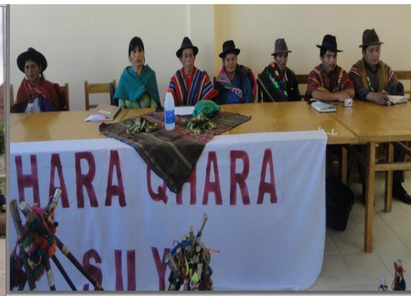
Cabildo: Reconstitución del territorio ancestral de Parcialidad Wisijsa- Nación Qhara Qhara (Autoridades de Jatun Ayllu Yura y nacion Qhara Qhara)