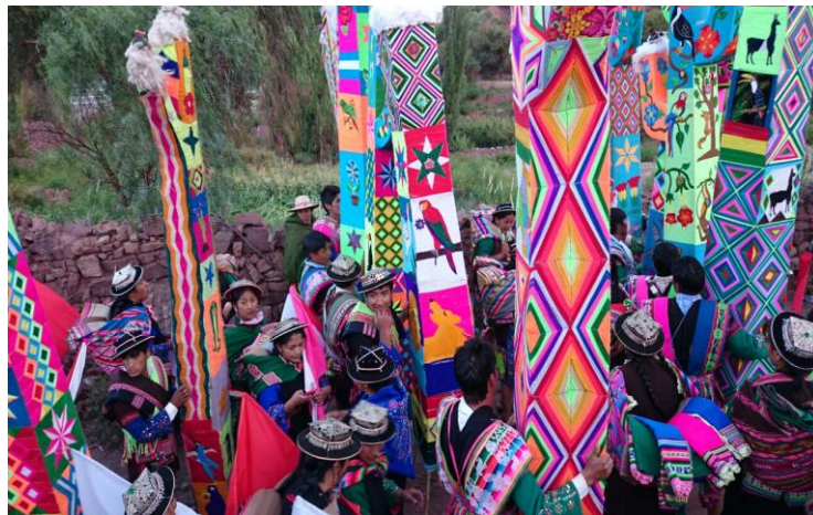
Participación de los jóvenes en valoración de la cultura Yura (2015)

En carnaval las autoridades y alcalde originario realizan muyu o giro en su jurisdicción (Ayllu), acompañados de toda la población con la música tradicional que es entonada por los hombres con las flautas y caja, mientras que las mujeres bailan en ronda con su ropa típica. La norma interna de Yura es respetada porque todos los que participan con la fraternidad de baile, deben vestir con ropa típica; cada kuraca y alcalde visita a cada familia en su jurisdicción y el día anterior al Carnaval, se concentran todos en el pueblo de Yura. Las mujeres visten acsu, aymilla, phanta, montera con estrellas de plata, chumpi, cañari y llejlla; los hombres visten con uncu, chalina, poncho, montera con estrellas de plata, chuspa, chumpi, cóndor huma, león y cóndor. Los jóvenes, así como participan de actividades culturales ancestrales, también participan en consejos de autoridades a nivel de comunidad, ayllu y jatun ayllu, donde debaten y participan de la gestión de temas como la educación, salud, proyectos, cultura, economía, política y justicia indígena originaria. Por eso se considera que ellos son el sostén del pueblo Yura, pues garantizan la sostenibilidad y la perspectiva a futuro de todos los proyectos.