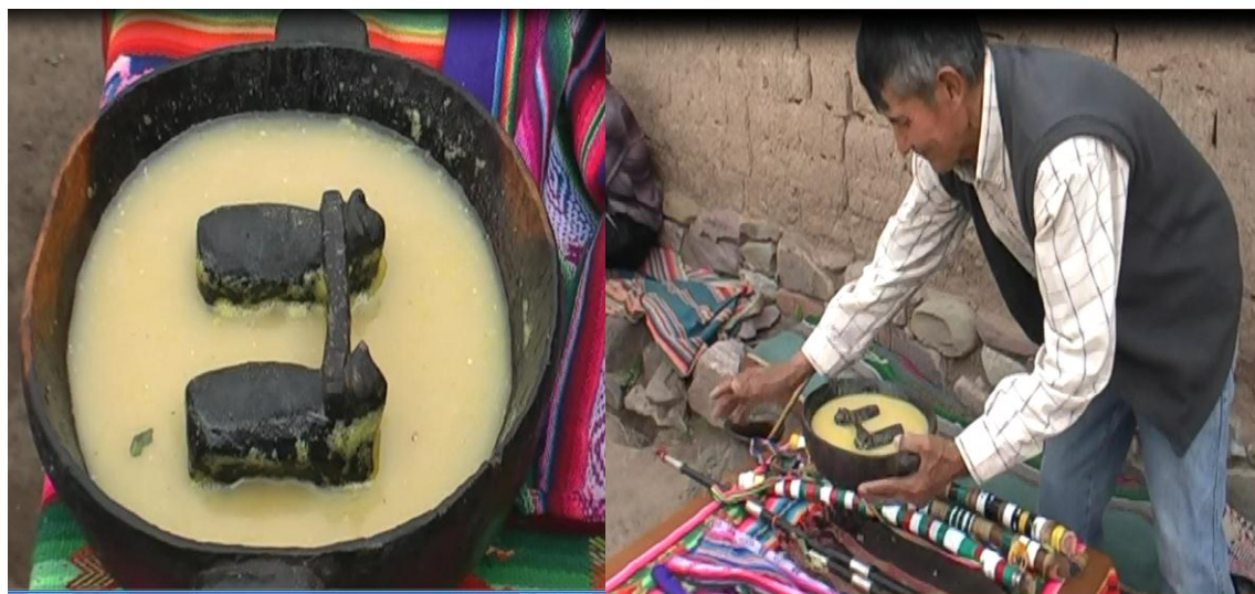
Símbolo: Challa en raimé de carnaval – Alegría por la madre tierra que produce para los ayllus de Jatun Ayllu Yura