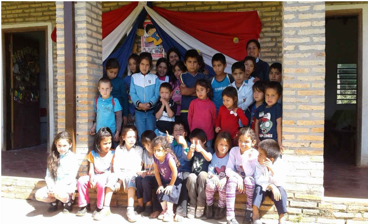
Niños y niñas en la escuela del Asentamiento Che Jazmín

“Buscamos mejorar la calidad de vida de los niños y niñas en su territorio/ Jaheka ñande mitakuéra toikoporâve hekohápe” (Docentes de la Escuela Básica N° 7433)