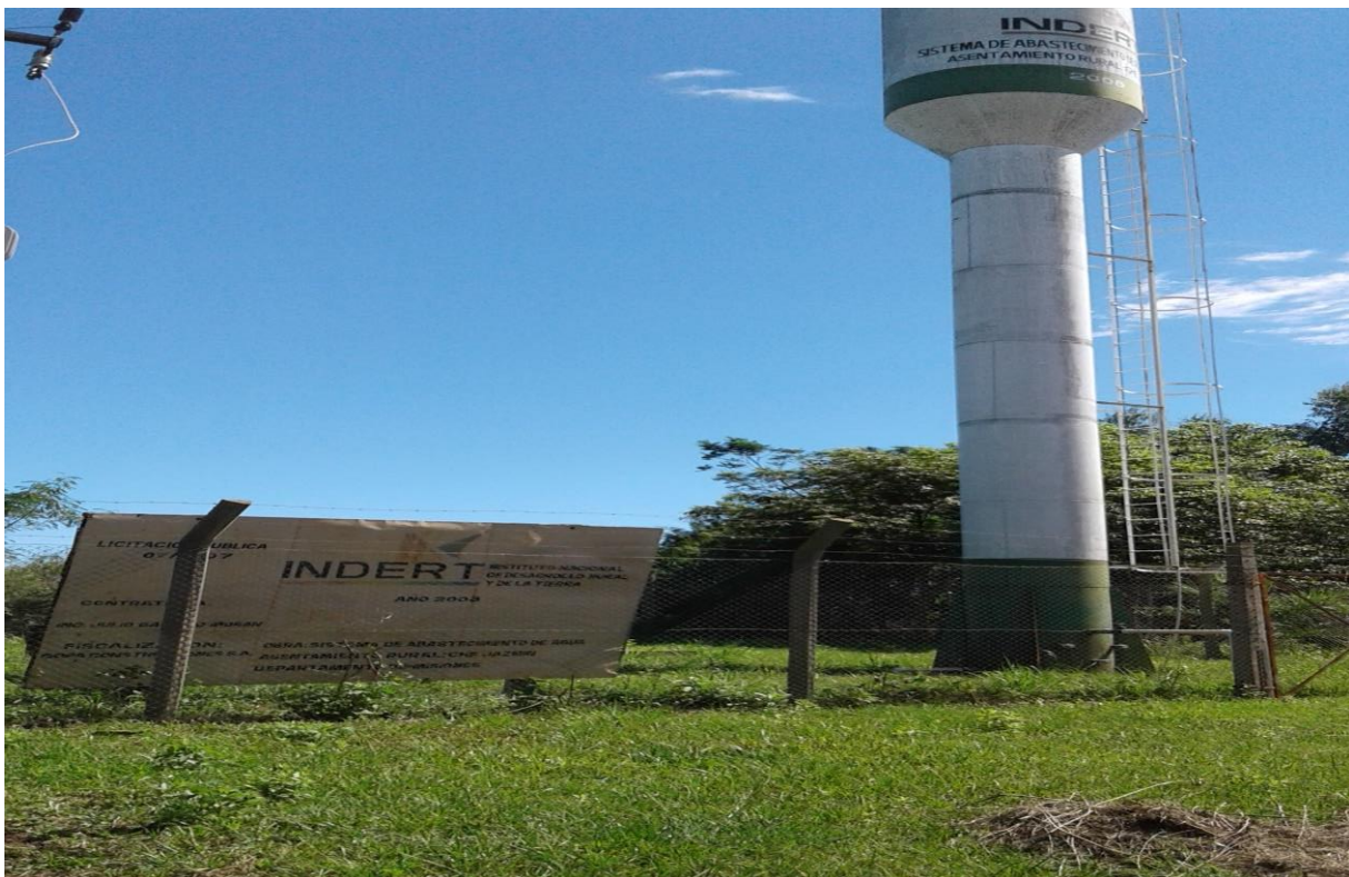
Servicios de Agua Potable-Asentamiento Che Jazmín