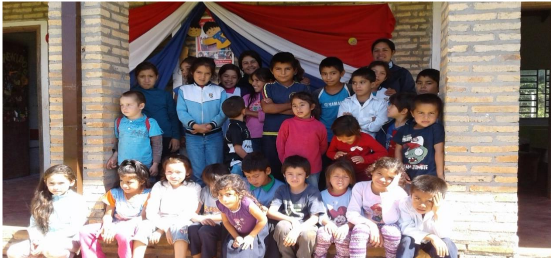
Niños y Maestros en la Escuela del Asentamiento Che

La infraestructura para la Escuela, fue obtenida en el año 2010 gracias a la Coordinación Ejecutiva para la Reforma Agraria. Antes de la construcción de la Escuela Básica N° 7433 Che Jazmín, las clases se desarrollaban en el centro comunitario del asentamiento que era la casa de familia Brae.