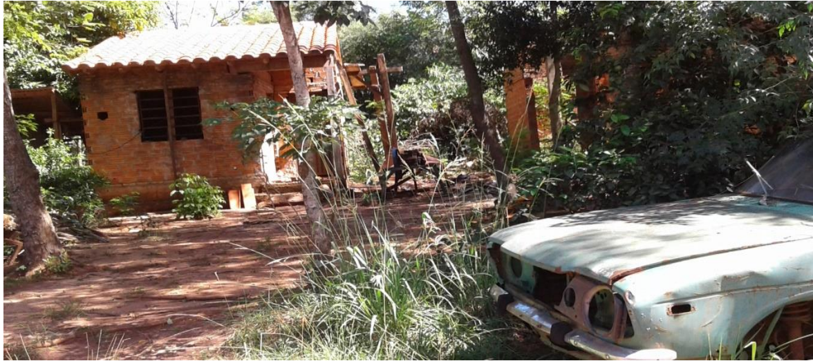
Viviendas hechas por SENAVIDAD sin terminar en el Asentamiento