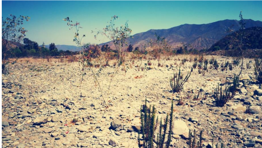
Vista del río Petorca. Sector La Canelilla

colaboración basada en la honestidad, equilibrio, perseverancia, transparencia, compasión y bondad, donde el bien común, el derecho a la tierra y la gobernanza del recurso hídrico son sus batallas cotidianas y de donde extraen en la fuerza para seguir luchando