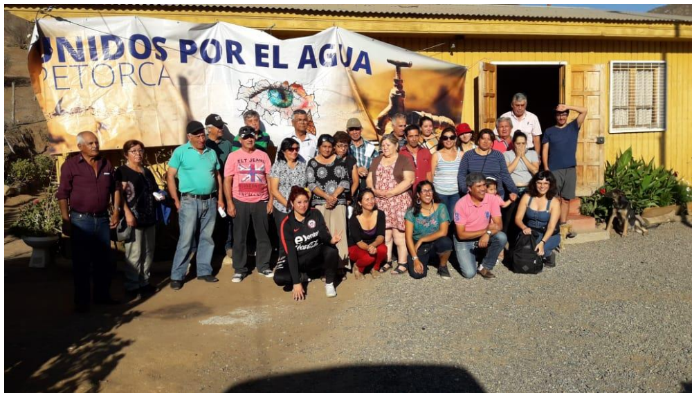
Ambas Fotografías son de la Mesa del Agua en sector Manuel Montt. Febrero 2020