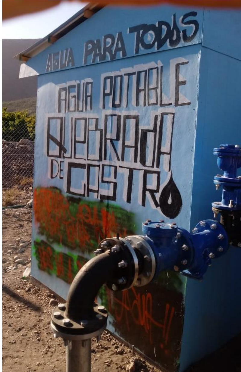
APR Quebrada de Castro. Petorca. Chile.