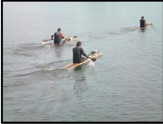
Argonautas del embalse

ECUADOR MOVIMIENTO REGIONAL POR LA TIERRA