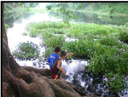
Niños del embalse