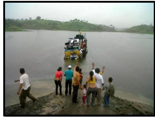
El primer círculo del infierno