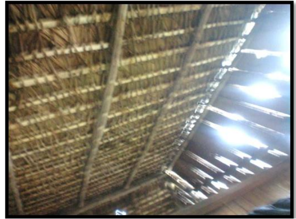
Casa ecológica de la familia Briones y puente del olvido, Daule-Peripa