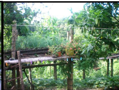
Eras de subsistencia familiar