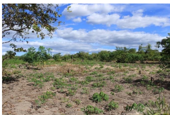
Áreas de cultivo

Remanso sempre se destacou na interação harmoniosa com a natureza, tirando seu sustento das roças, onde cultiva cereais e plantas medicinais, pesca, apicultura, extrativismo e turismo. A economia da comunidade depende dos rios Santo Antônio, Roncador e Utinga que se encontram e formam os Marimbus, nessa área as famílias quilombolas plantam, nos períodos de vazante agricultura de subsistência como banana, mandioca, feijão, abóbora, quiabo e extrai o azeite de dendê e mel.