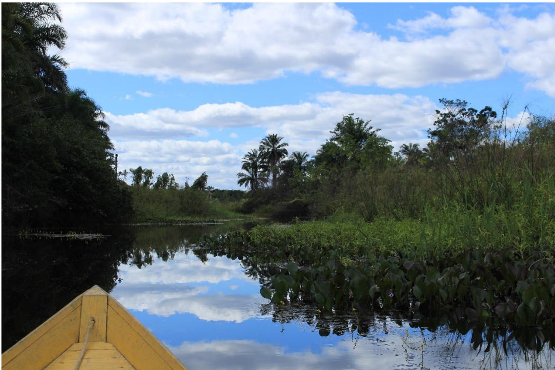
Marimbus: trajeto turístico