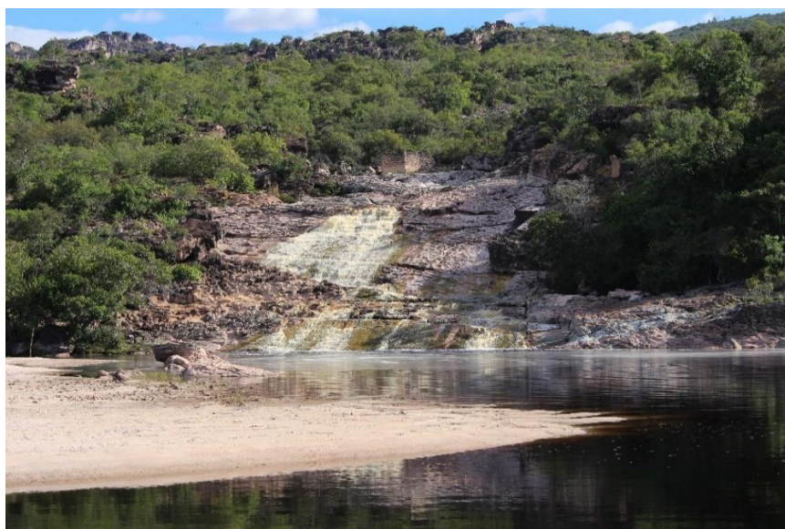
Visitação na cachoeira do Roncador – Parque Nacional da Chapada Diamantina.

Apesar da luta característica e da resistência apresentada, diante da opressão e dos latifundiários, a comunidade só foi reconhecida oficialmente como comunidade quilombola em outubro de 2006, pouco mais de um ano após protocolar o pedido da Fundação Palmares. Três anos após o decreto 4887/2003. A comunidade ainda carece do Relatório Técnico de Identificação e Delimitação do Território, mas são umas das poucas comunidades que tem uma área regularizada em nome da Associação, logo após a