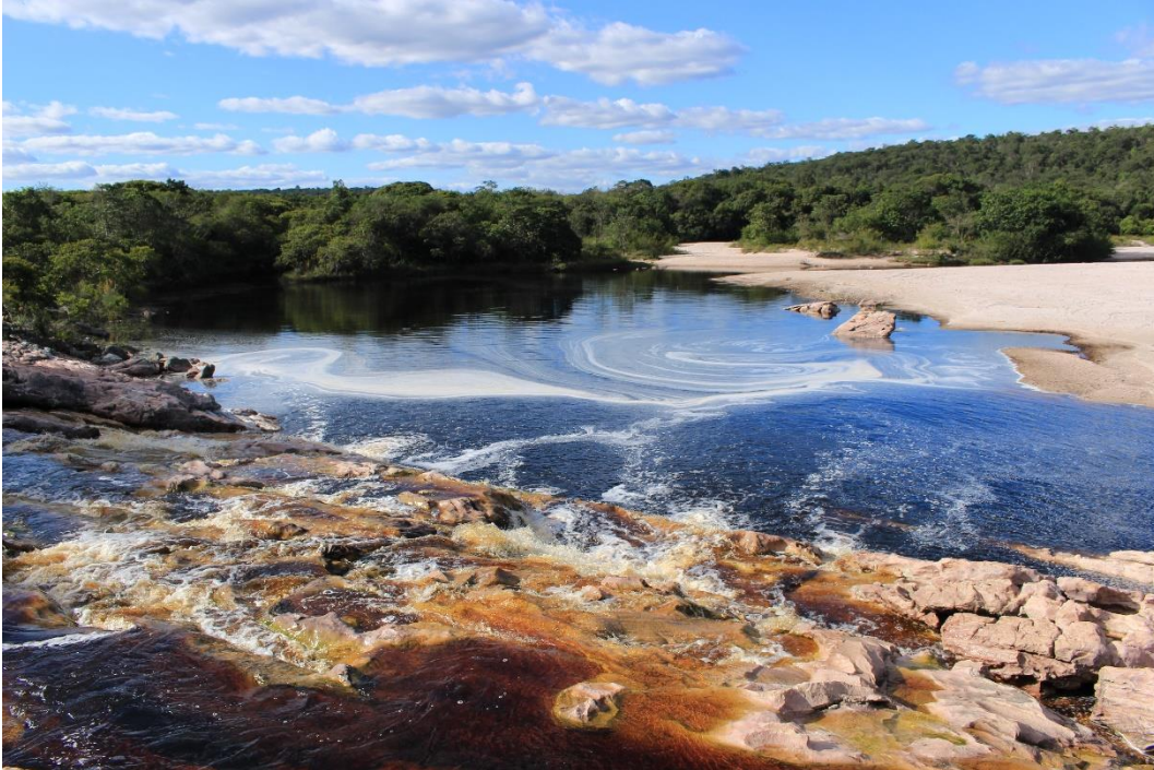
Cachoeira do Roncador: Trajeto Turístico