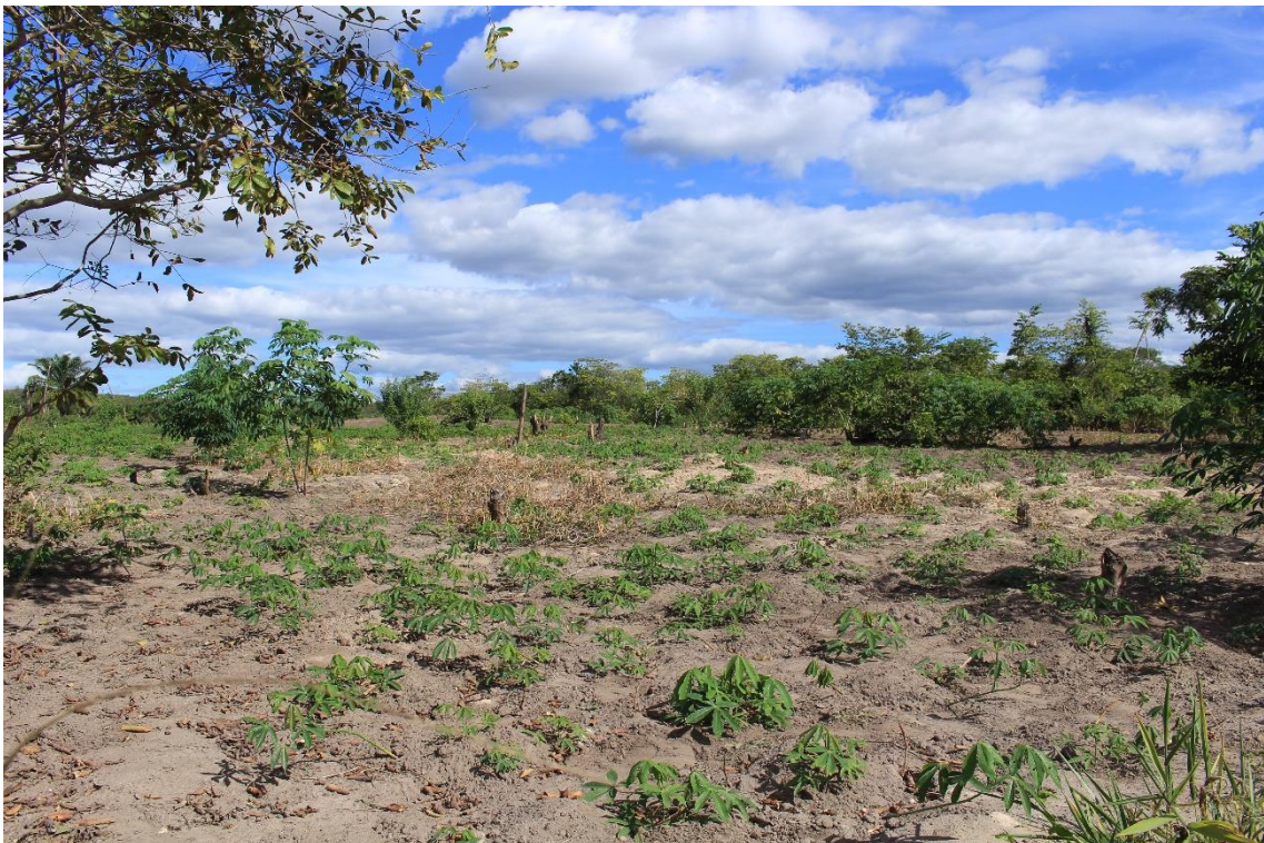
Plantio de Mandioca