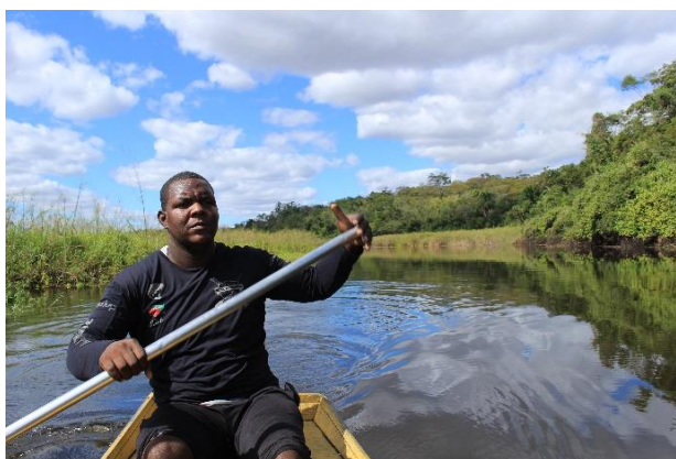
Trilha Marimbus cachoeira do Roncador

Com o Projeto Trilhas Griôs de Economia Solidária e Turismo de Base Comunitária; a comunidade de lençóis pode retomar algumas atividades culturais e econômicas, abrir-se ao mundo, revitalizar a sabedoria popular e melhorar a autoestima dos quilombolas.