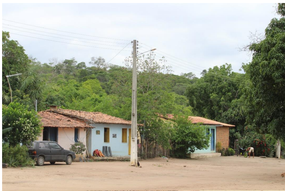
Comunidade de Remanso

Em 2011, tiveram acesso aos primeiros projetos como comunidade quilombolas, foram construídas 30 casas populares e cisterna de consumo humano, as outras 30 casas foram reconstruídas em mutirão pelos próprios moradores da comunidade.