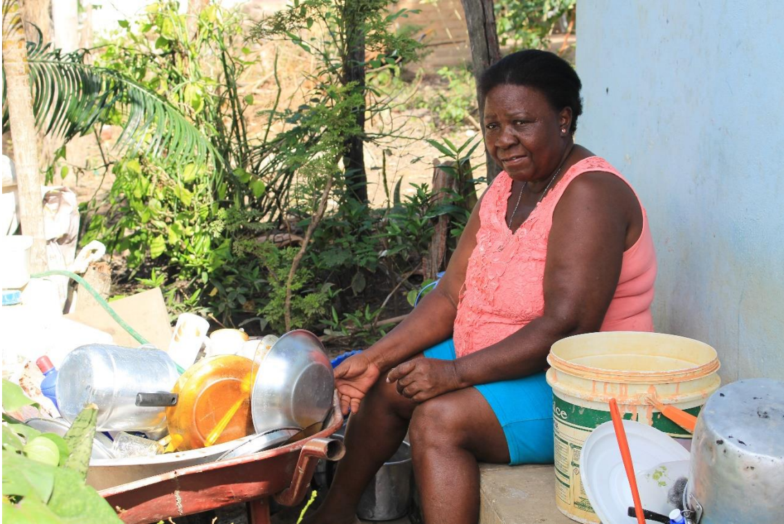
Moradora de Remanso