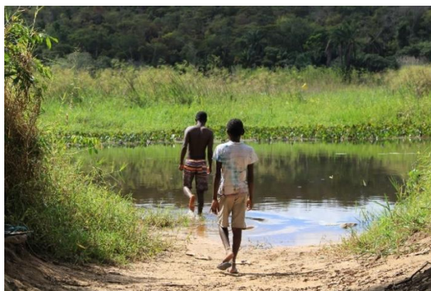
Lago de Remanso (espaço de lazer e pesca)