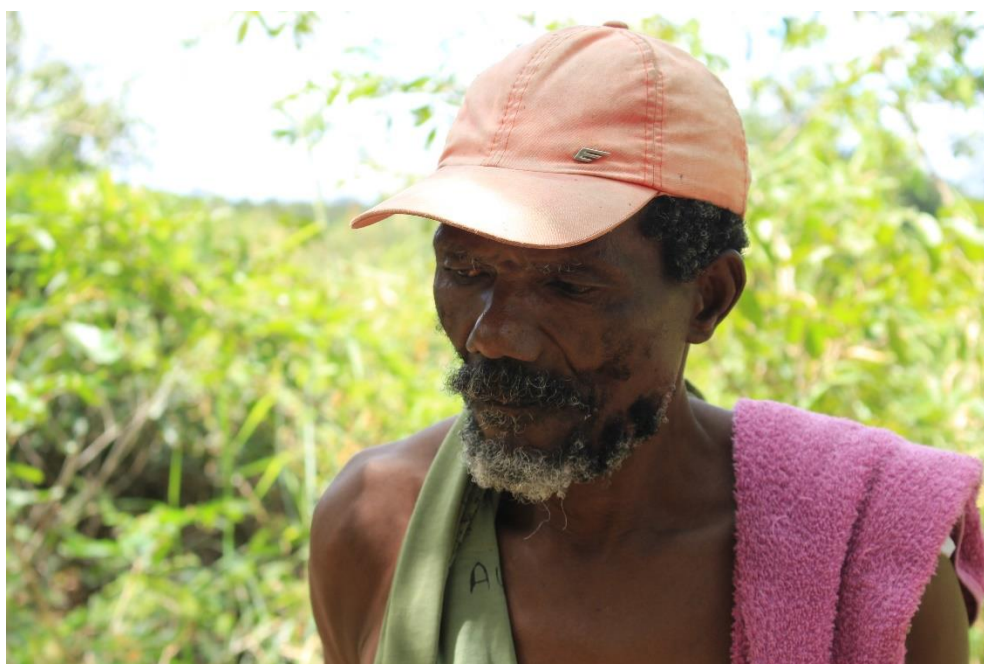
Morador da comunidade de Remanso