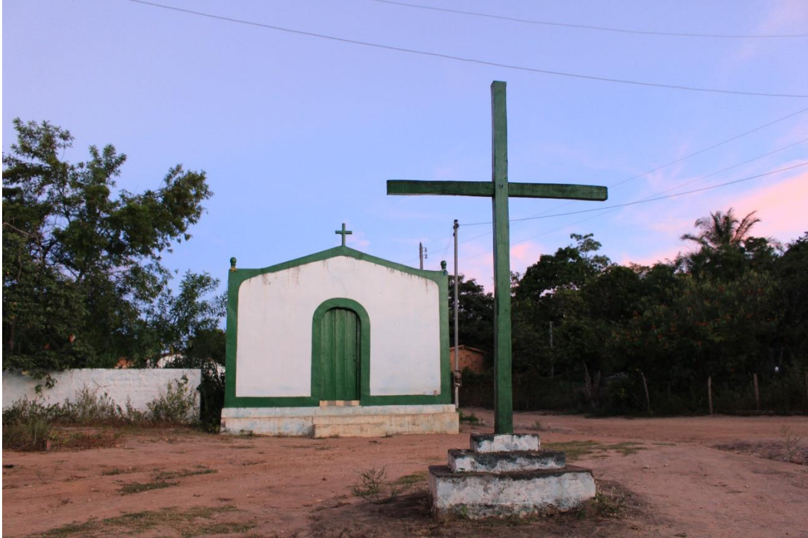
Igreja da comunidade de remanso