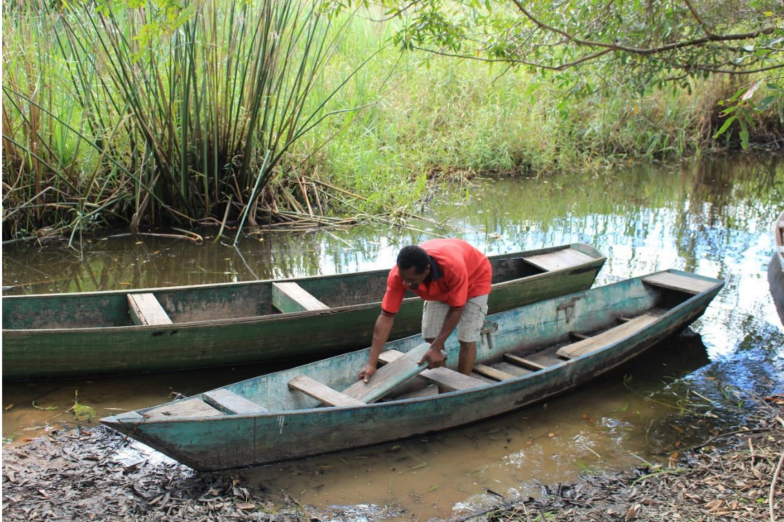
Recuperação de canoas a remo