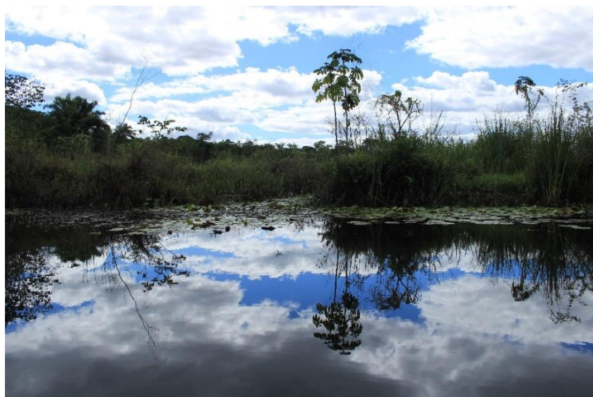
Visitação na APA – Marimbus/Iraquara