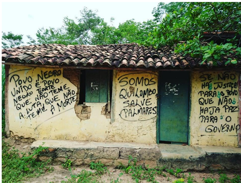
Antiga casa que retrata a luta quilombola