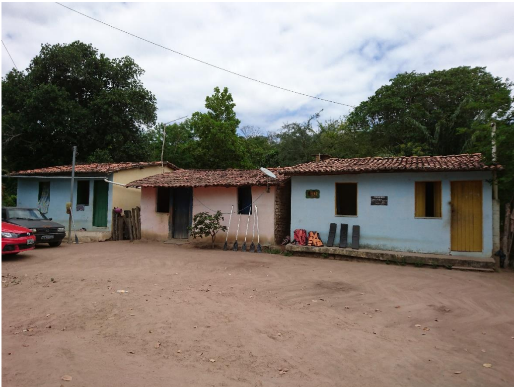
Novas residências de Remanso