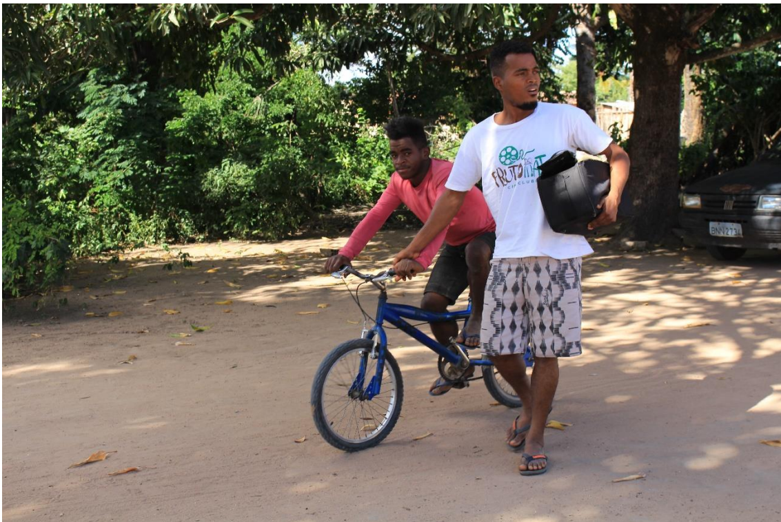
Entrevistas sobre a situação da água na comunidade