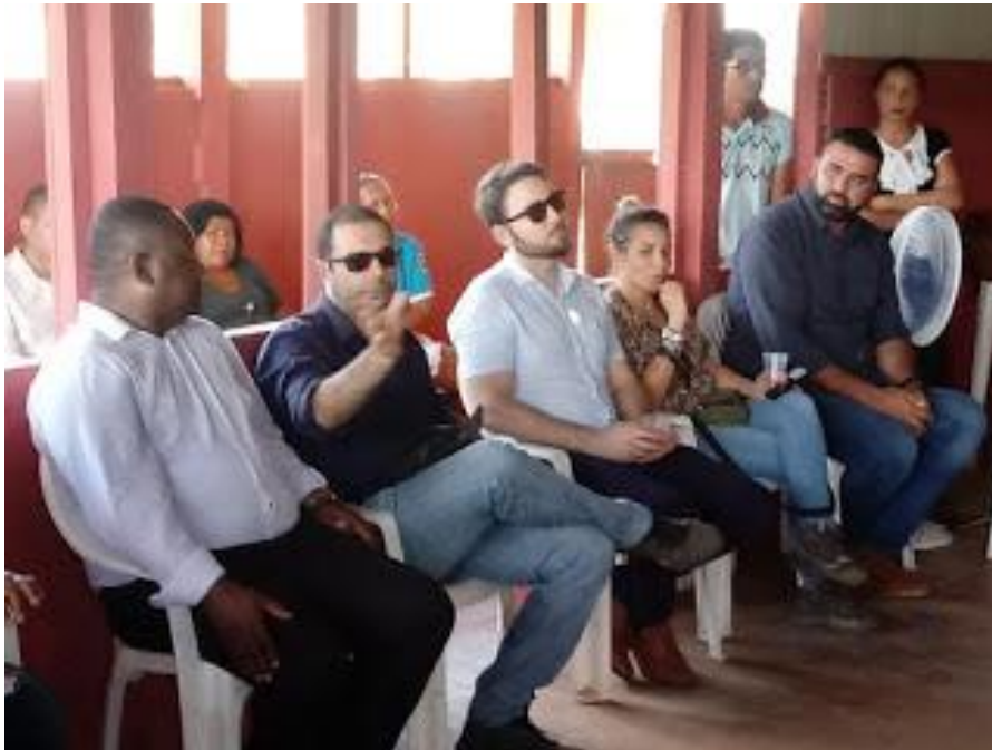
Audiência Pública em Costa Marques com presença do ministro da SEPPIR Posterior Inspeção Judicial Federal na comunidade.