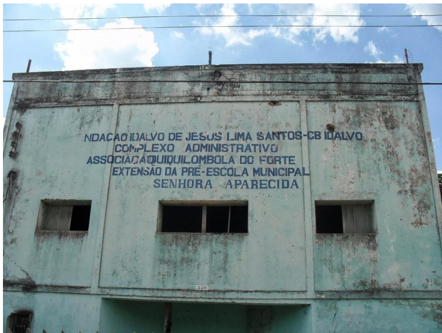
Extensão da pré-escola municipal Senhora Aparecida