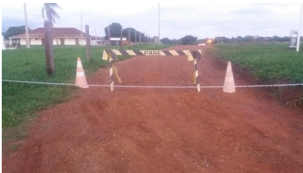
Acesso interditado ao porto civil da comunidade no rio Guaporé, 2017.