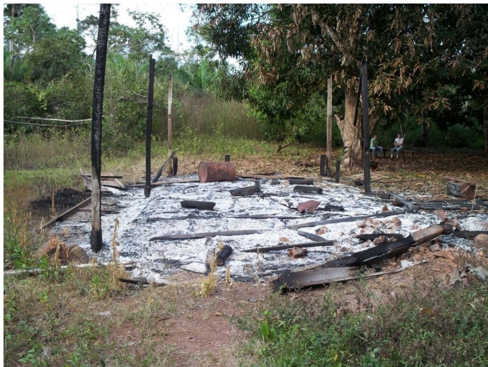
Casa queimada pelo Exército do seringueiro “Perna de Abelha”, novembro 2008.