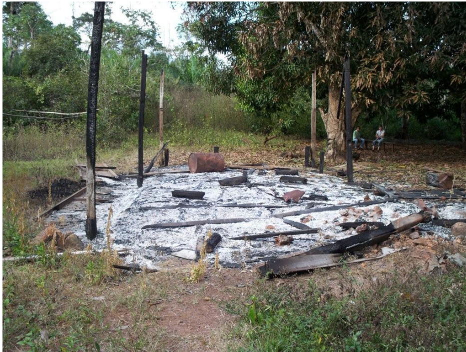
Casa queimada pelo Exército do seringueiro “Perna de Abelha”, novembro 2008.