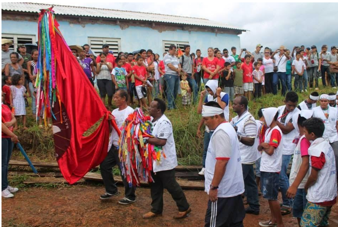
Chegada do Divino ao porto do Forte em 2014.

“[...] uma comunidade, um ajudando o outro, assim ia trabalhando na roça. O pessoal era muito unido, muito bacana, graças a Deus. Mas, vinha o gado do Batalhão e destruíu tudo”. (Francisca da Gloria)