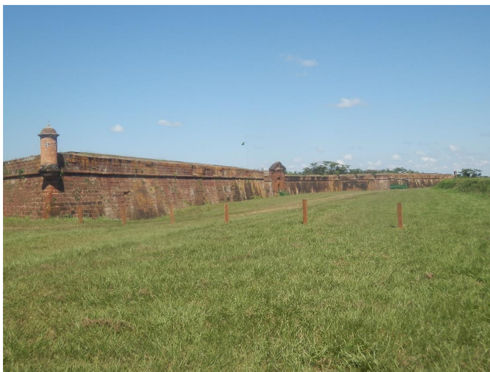
Foto: Intento do Exército de cercar o acesso a entrada ao porto e a Fortaleza, julho de 2015.

Assim as últimas décadas as famílias quilombolas têm sofrido constantes pressões, para que saiam da área pretendida, pelos diversos Pelotões militares que já atuaram na região. A intrusão das terras tradicionais pelo Exército, as pressões e os atos de violência têm impedido a ocupação plena do território quilombola, como a realização das práticas agrícolas, da pesca, de turismo, a construção e reforma de moradias, o acesso ao porto do Rio Guaporé, o acesso à educação e à saúde sem constrangimentos.