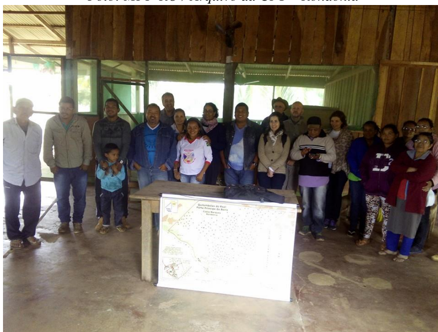
Apresentação de Mapeamento Social do território da comunidade quilombola do Forte, 2014.