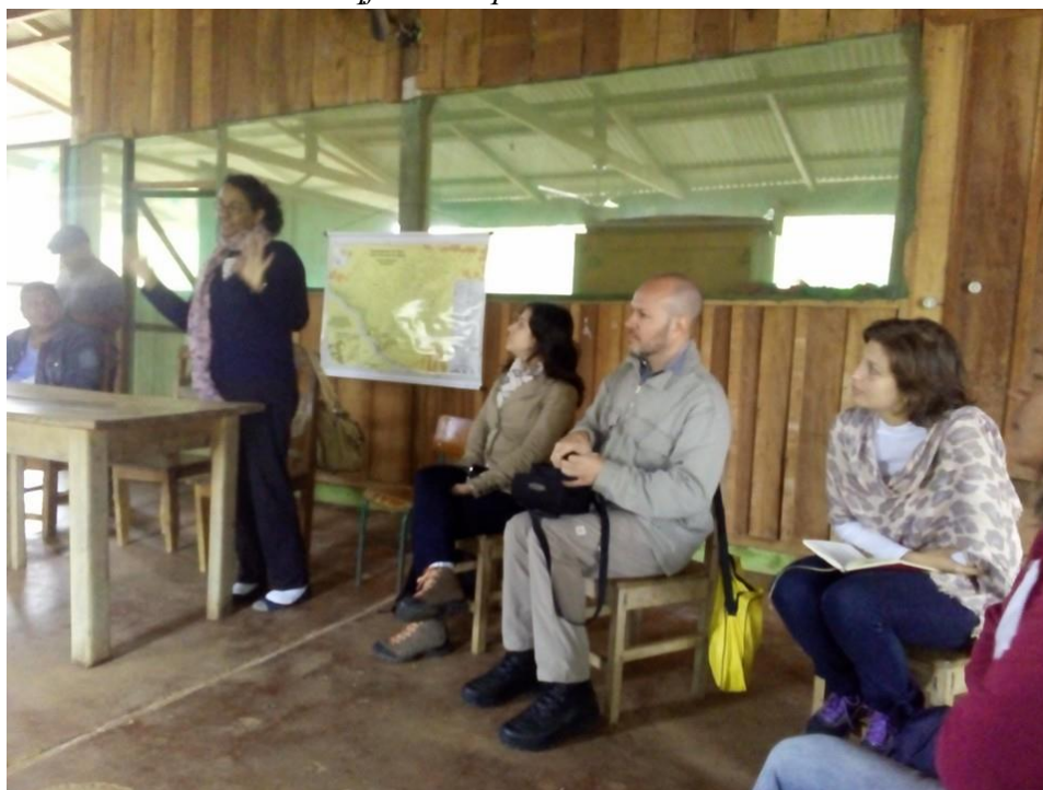
Projeto de Nova Cartografia Social da Amazônia com a associação quilombola do Forte Príncipe da Beira