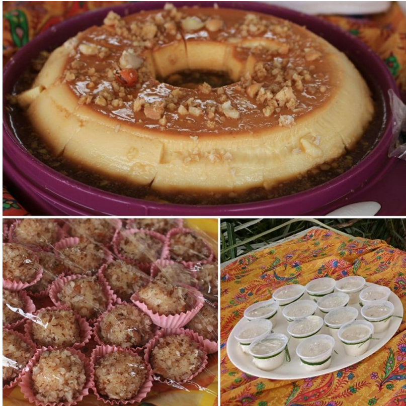
Comidas típicas a partir do licuri(pudim, Beijinho e sorvete)