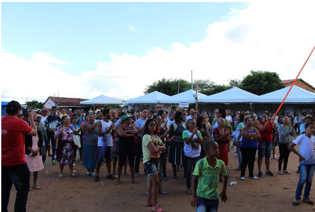
Espaço da festa do Licuri com músicas, danças e muita comida