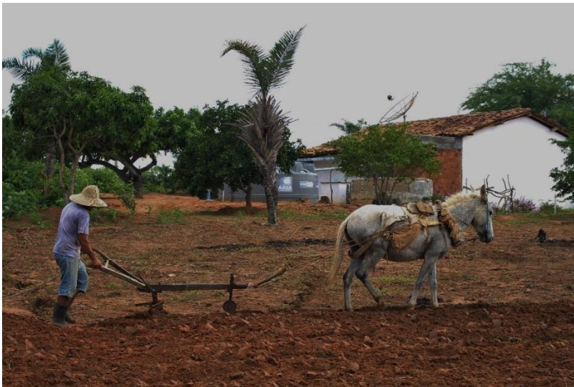
Preparação da terra para o plantio