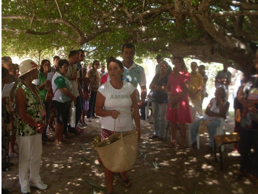
Coleta de frutos – Mutirão durante a Festa do Licuri