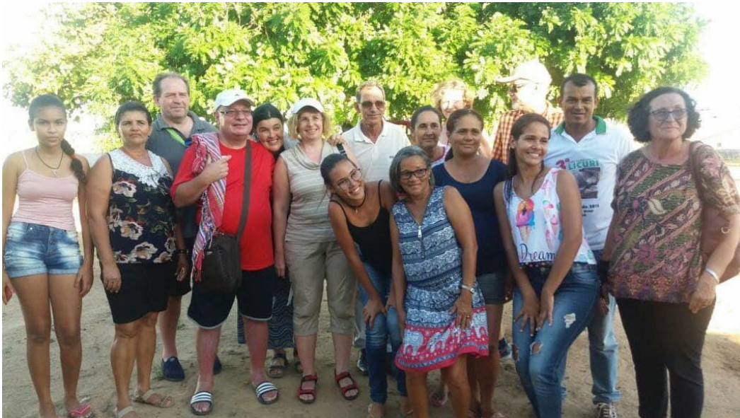
Visitas de parceiros da Áustria e Eslováquia – DKA