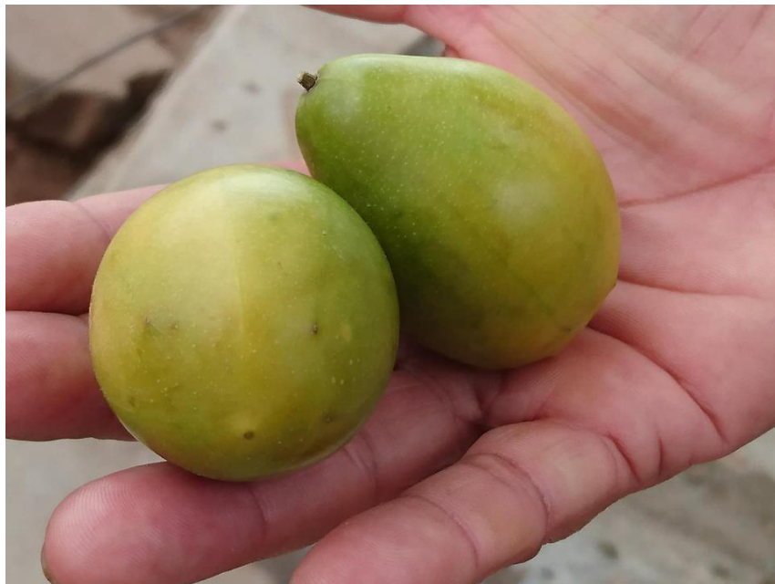
Fruto do Cajá – Planta típica da região semiárida