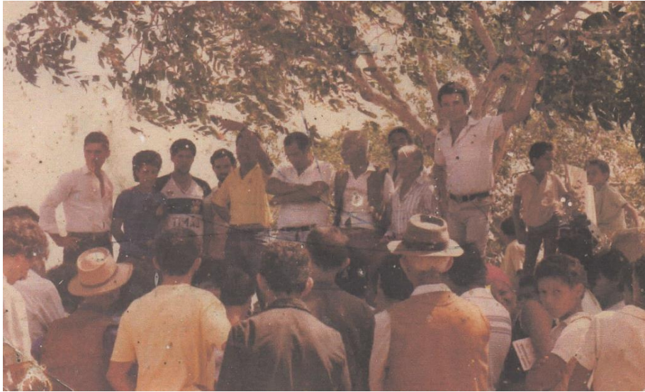
Reunião da Associação Comunitária do Uruçu