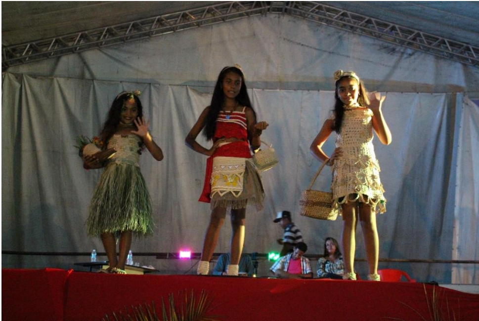
Concurso da princesa do Licuri (ano 2018)