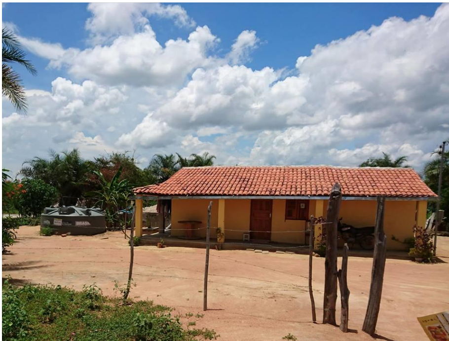
Moradia do atual presidente da Associação Comunitária do Uruçu