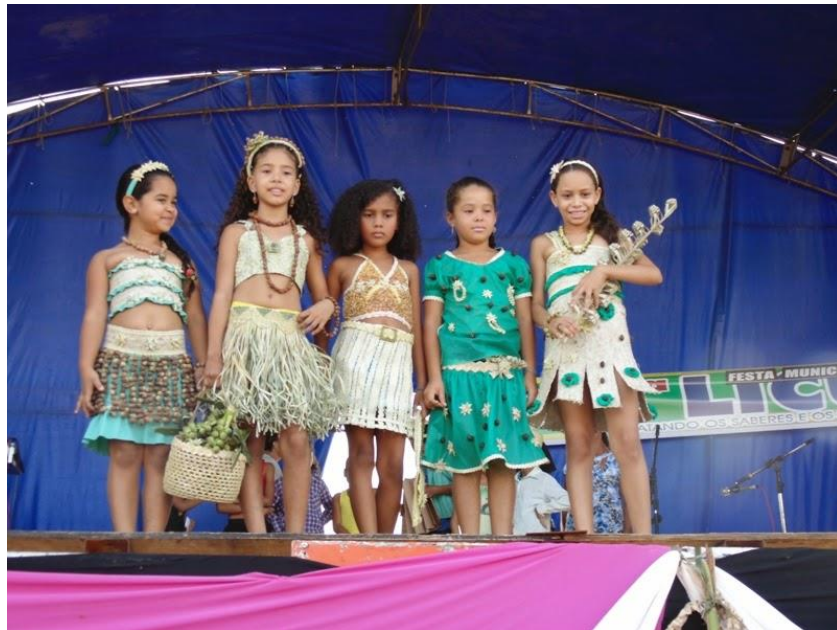
Concurso da princesa (ano...