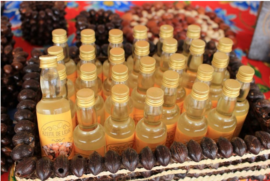
Azeite de licuri – Prensado a frio (produto agroecológico com grande valor nutricional)