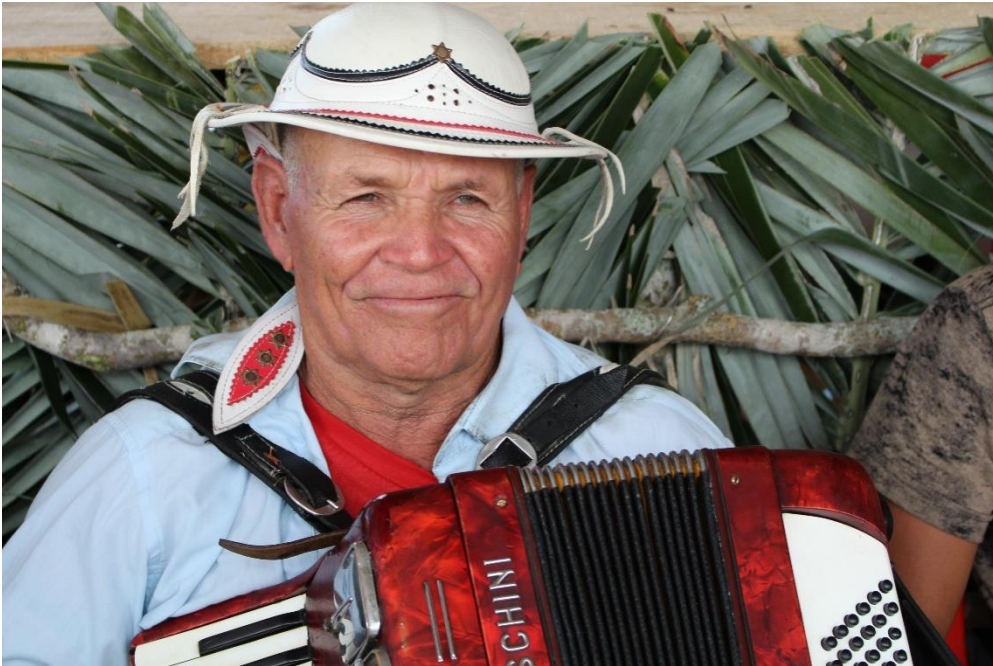
Sanfoneiro/Forrozeiro na festa do licuri 2018