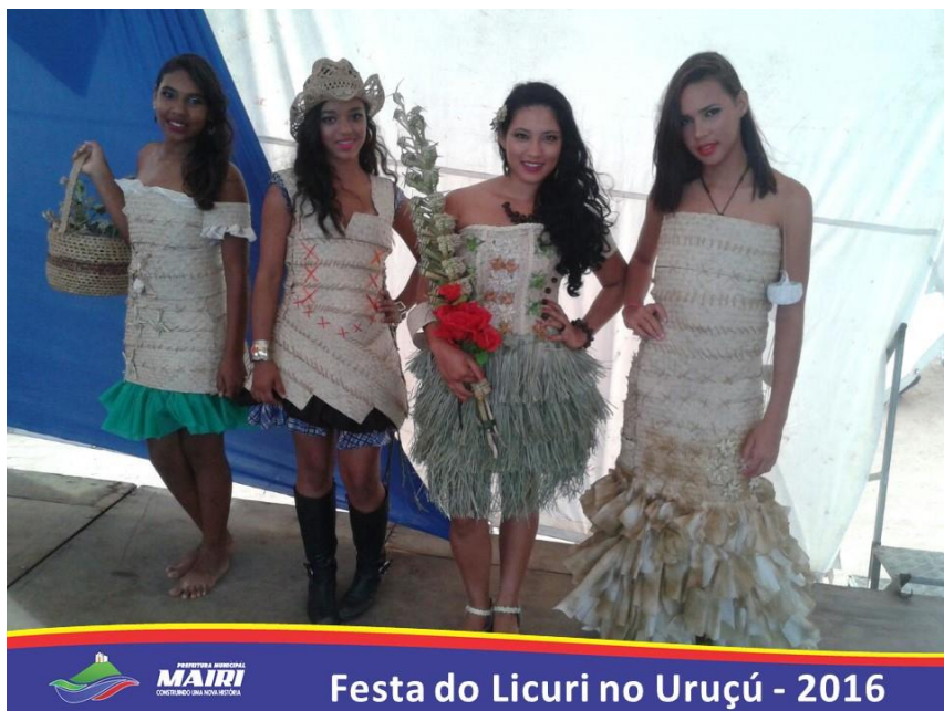
Concurso da Rainha