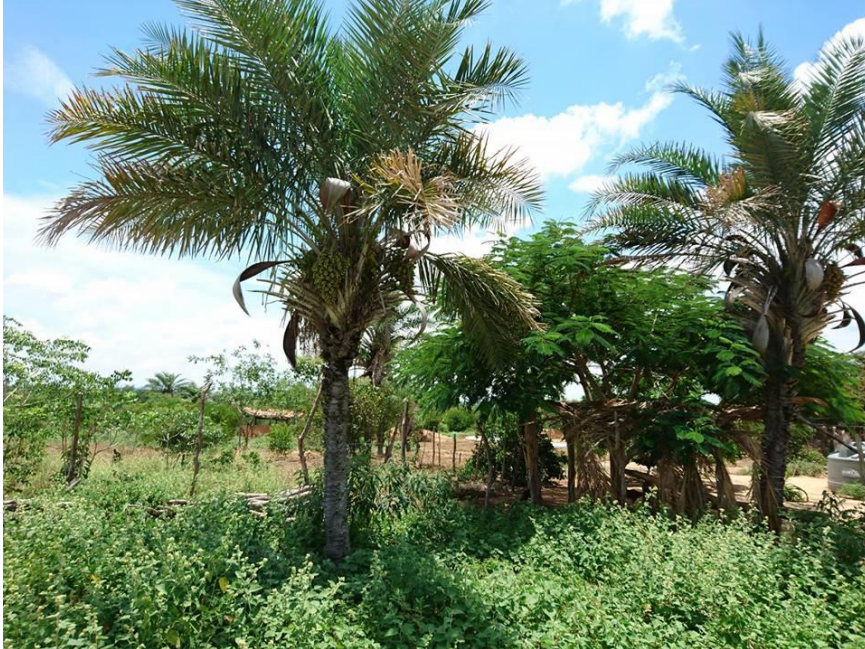
Palmeira do Licuri – o carro chefe na economia local