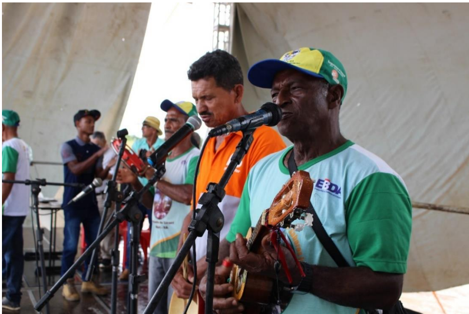
Sambadores na festa do Licuri 2018