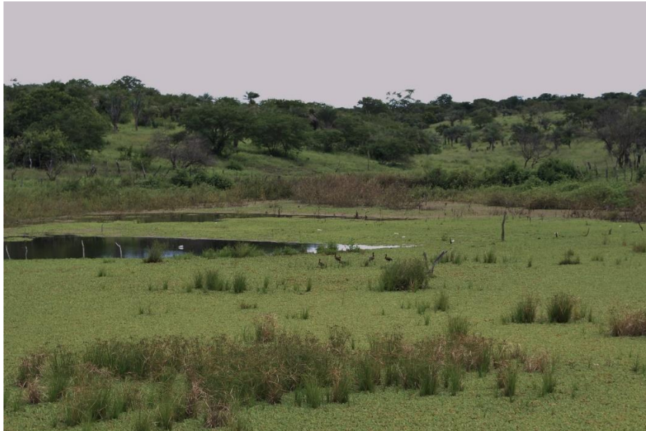
Aguada (barragem para produção)