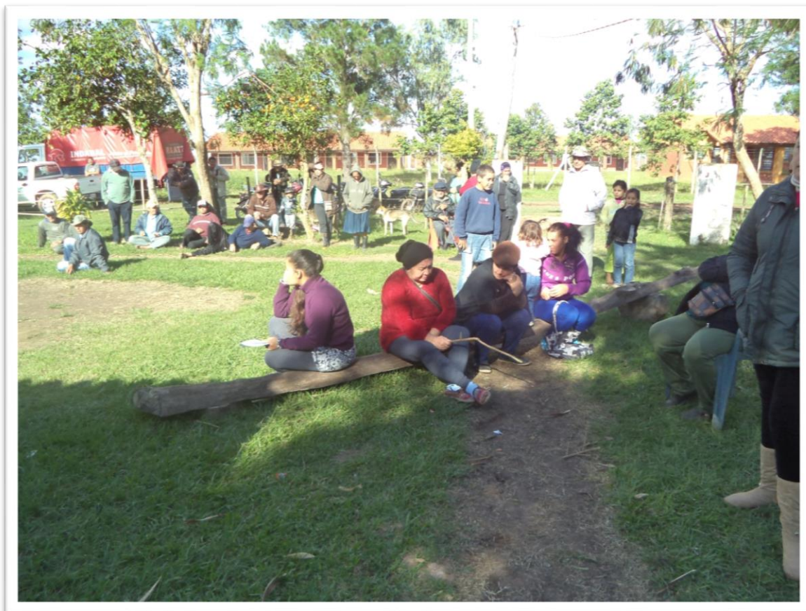
Miembros del Asentamiento 29 de Octubre-Santa María Misiones.