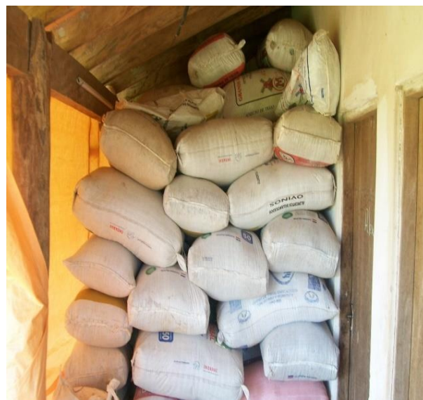
Secado y almacenamiento de arroz de los socios del Asentamiento

En el 2010, una tormenta causó estragos, derrumbó varias casas causando una gran pérdida a las familias. Luego vino una creciente que inundó todas las casas, el asentamiento permaneció bajo agua por ocho días.