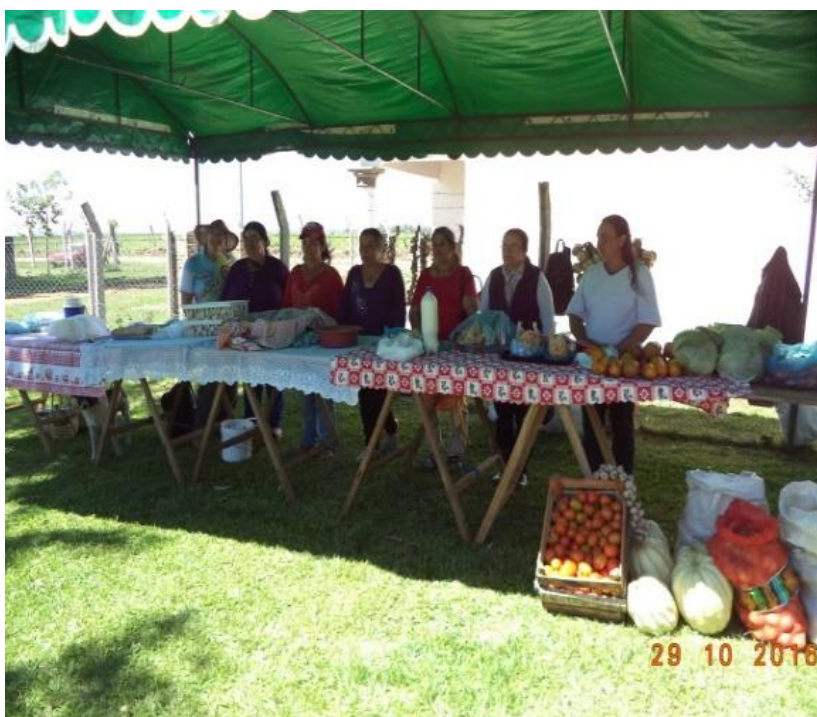
Exposición de productos, 8 de diciembre

Para las actividades de esparcimiento, cuentan con una cancha de fútbol para la recreación de los niños y jóvenes, y ocasionalmente, los adultos organizan pequeños torneos para la distracción después de los trabajos diarios.