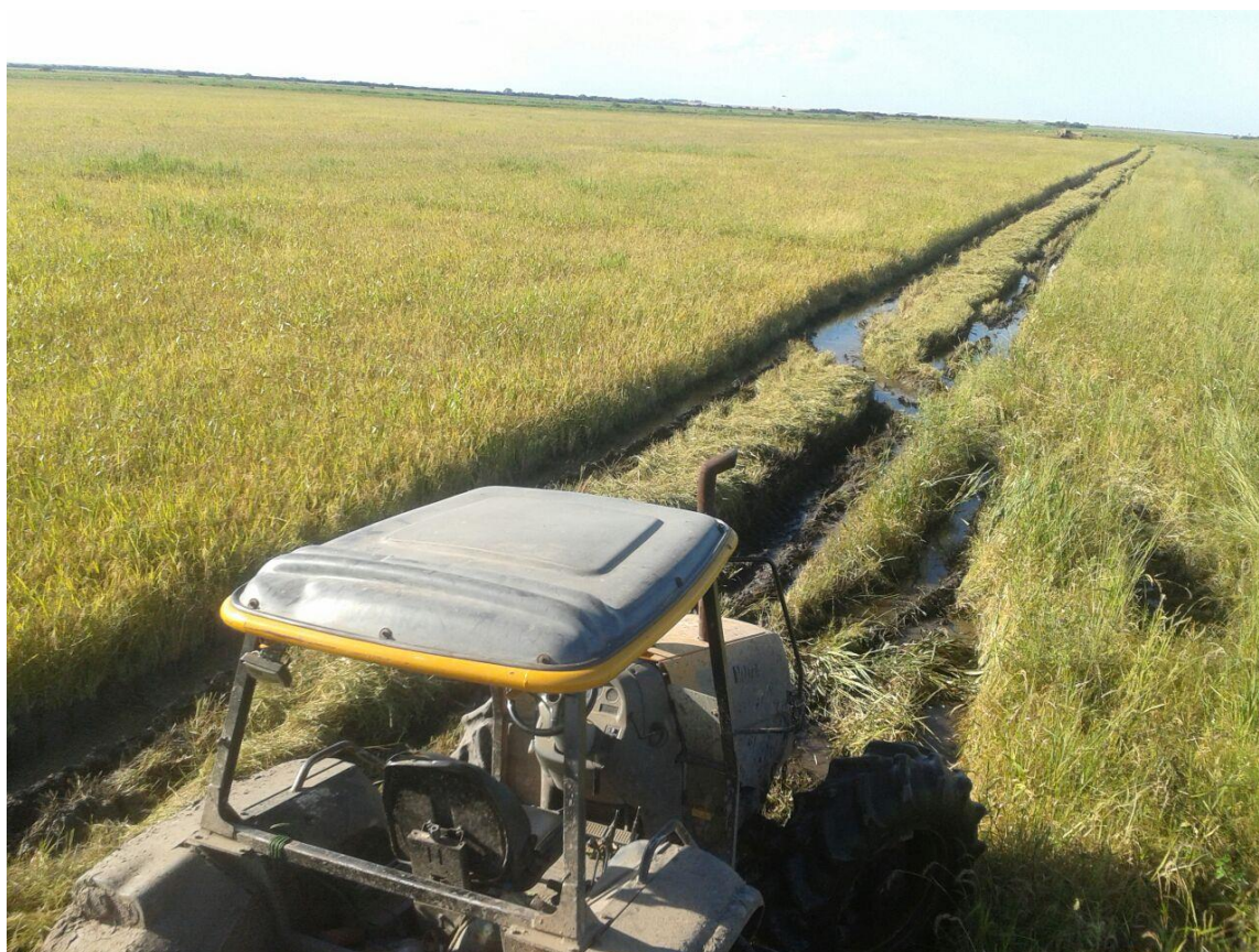
Canalizaciones con máquinas para el cultivo de arroz

En el 2003, se hicieron las primeras canalizaciones, con máquinas de la gobernación para adecuar la parcela para la siembra de arroz.