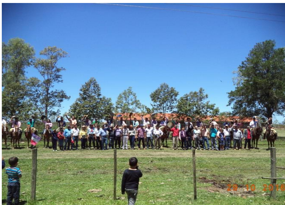
Desfile de caballería

Entre las actividades sociales de la comunidad, se cuentan las actividades deportivas de fútbol 7 y vóley como distracción habitual. En el asentamiento, se habla guaraní y español. Se elaboran las comidas típicas del Paraguay. La comisión vecinal realiza constantemente actividades como torín , fútbol 7, jineteadas y carreras de caballos para la recaudación de fondos para cualquier gestión que se pueda realizar dentro del asentamiento.